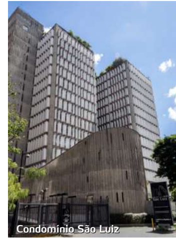
Condomínio São Luiz